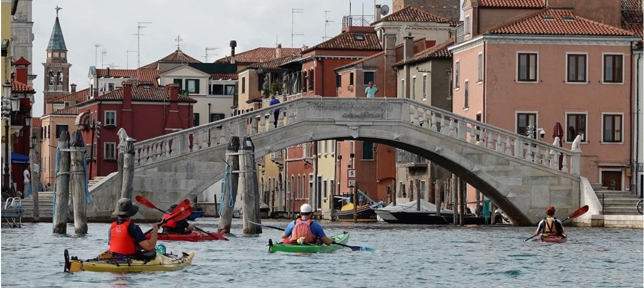
Chioggia, die bezaubernde „kleine Schwester“ Venedigs in der südlichen Lagune.