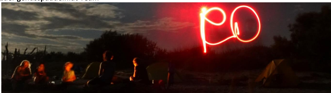
Am Lagerfeuer mit Taschenlampe und langer Belichtungszeit ...

Bis dann auf dem Wasser! Euer genusspaddeln.at Team